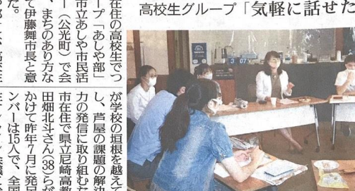
伊藤市長(右から2人目)と懇談する高校生たち(芦屋市で)

【本紙記者 伊藤舞】あしや部の高校生が、伊藤市長と懇話会を開き、芦屋の魅力を語り合った。あしや部の高校生らは、伊藤市長と懇話会を開き、芦屋の魅力を語り合った。あしや部の高校生らは、伊藤市長と懇話会を開き、芦屋の魅力を語り合った。