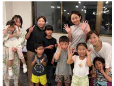
▲8月18日(金)開催参加メンバー

◀左:今日はママが先生!子どもたちもしっかりお話を聞いています。 右:身体のケアについての座学