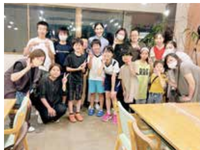
▲6月16日(金)開催参加メンバー