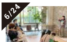
6/24 NPO法人「絵本で子育て」センター