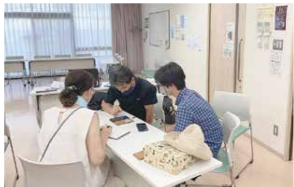
▲第2部：高校生ボランティアと一緒にトライ！

第2部は、希望者を対象に、普段からInstagramを使い慣れている高校生にボランティアアシスタントとして加わってもらい、写真の投稿の仕方など、スマホでの操作方法を学びました。