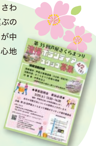
▲スタッフ募集チラシも自分たちで作成!

まずは、事前説明会で役割分担を決め、ボランティア保険加入を促し当日に臨みました。終了後は、振り返り会を開きました。「割れたもの、お酒などの飲み残し状態のビンの回収方法を考える」「プラスチックのコップが燃えるゴミかペットボトルかを迷う人多数。次回からは文字、絵で記載した方がいい。外国語も必要である。」「たくさんの感謝の言葉をいただき嬉しかった」など、色々な意見が出ました。