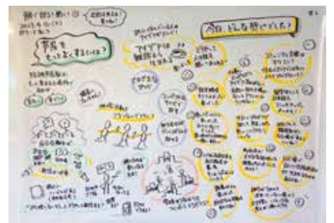
▲ナミさんのグラレコ