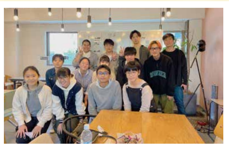
▲ボランティア参加者メンバー