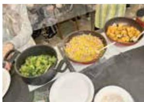
▲みんなで調理したごはん