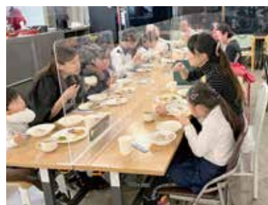
▲みんなで楽しいごはんタイム