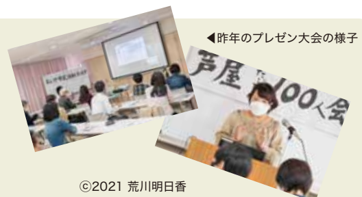
◀昨年のプレゼン大会の様子