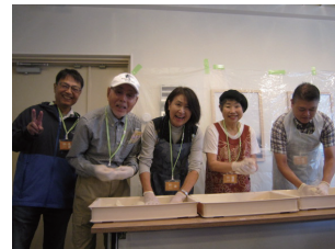
参加団体 | AC32サニーカフェ、芦屋大学ボランティア部Aqua、芦屋やまぼうし、尼崎信用金庫