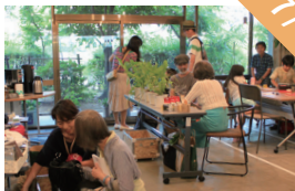
インテリアと グリーンの整理バザー ポイエシス