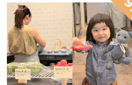
子どもとオトナの プチマルシェ がんばるママーズ