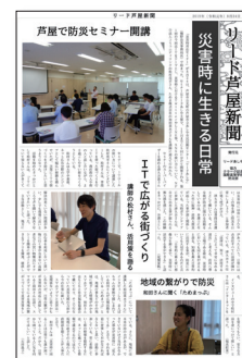
▲高校生新聞記者作成の新聞