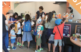
スマイル カフェ スマイルボランティア