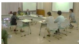
5月「ふれあいつどいカフェ」