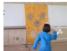
6月「ふれあい宇宙カフェ」