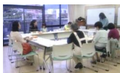
4月「ふれあい春色パステルカフェ」

4月からオープンした「ふれあいカフェ」、毎月たくさんの方々にご参加をいただいております。4月は公光町自治会による「ふれあい春色パステルカフェ」でした。3色パステルアートの技法を使って春の絵を描く体験をしました。5月は就労継続支援B型事業所ウィズ芦屋による「ふれあいつどいカフェ」。障害や事業所についての説明の後で参加者と一緒に、事業所が地域に根差す方法などについて、ディスカッションが行われました。6月は日本宇宙少年団六甲分団の「ふれあい宇宙カフェ」。映像を見ながら宇宙の話聞き、ロケットを作った当てをしました。どのカフェも楽しい時間を過ごすことができました。（出口）