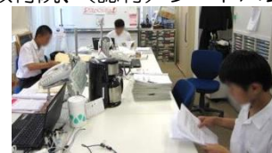
精道中学校 3名 6月4日～6月8日