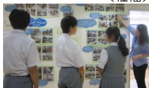
潮見中学校 3名 5月28日～6月1日