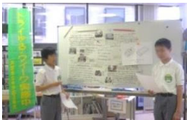
山手中学校 2名 5月21日～5月25日