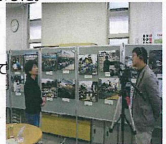
あしや市民活動センターで 震災パネル展開催

震災直後、仮設住宅訪問から続けた活動も試行錯誤しながら徐々に形を変え、今では皆さんが集まって手芸することで、彩りや形の話で会話が弾み、交流が深まっています。2ヶ月に1回の例会では、手芸好きのメンバーが集まって、高齢の方でも作れオリジナルの作品を工夫するのも楽しい一時です。