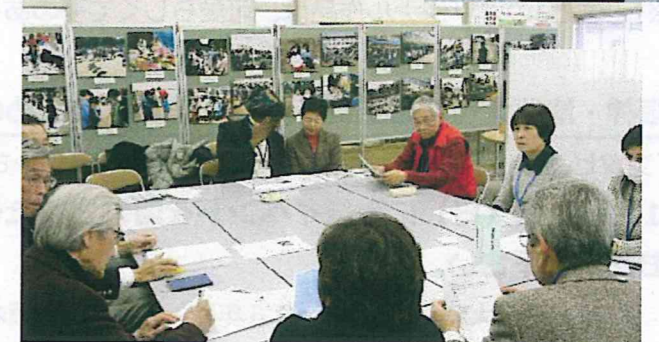
市民活動センターで開かれた国際交流のテーブル

初めての顔合わせも多い中、どのテーブルも親睦も兼ねて、活発な意見交流が行われていました。