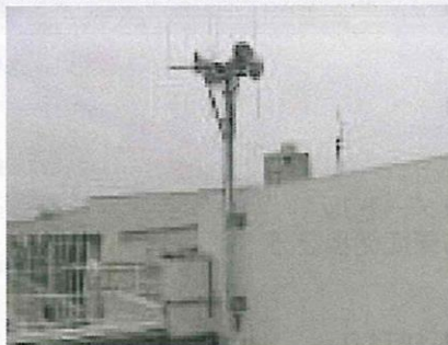
防災行政無線 屋外拡声子局設置風景

災害発生時に独居高齢者や障がい者の安否確認などをする「災害時要支援者支援計画」の策定を進めています。個人情報のため名簿の把握がなかなか進みませんが、昨年からは、より機動性のある、現実に則した計画になるよう、担当各位と検討を重ねています。