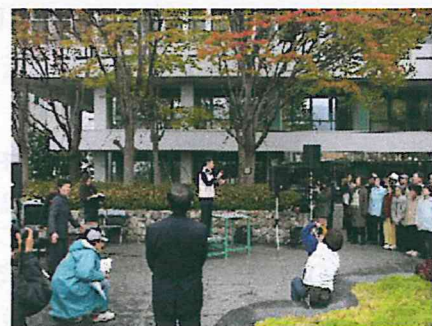
イベントを支える“裏方”さんも 非常に大切なのです。(手話、大道具など)