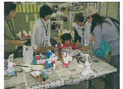
シニアから子供への おもちゃづくりを通じた“つながり”

(昨年は音響やイベント進行のボランティアなど専門性の高い方のご協力もあり、大変助かりました。)