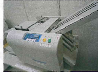
音は大きいけど、かなりの速さで紙を折り続けます。(500枚程度なら数分で)