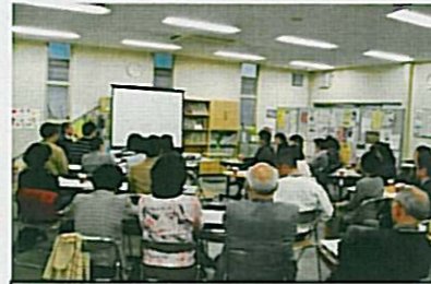
4/10「こころの病」交流会