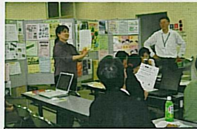
5/8「チラシ作成」交流会